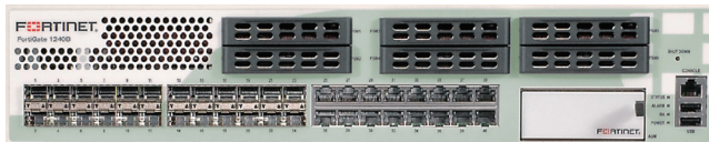
FortiGate-1240Bアプライアンス(正面)

数値はすべて「最大」の性能値であり、システム構成に応じて異なります。アンチウイルス パフォーマンスは、44 Kバイト HTMLファイルを用いて測定されています。IPSパフォーマンスは、1 Mバイト HTMLファイルを用いて測定されています。